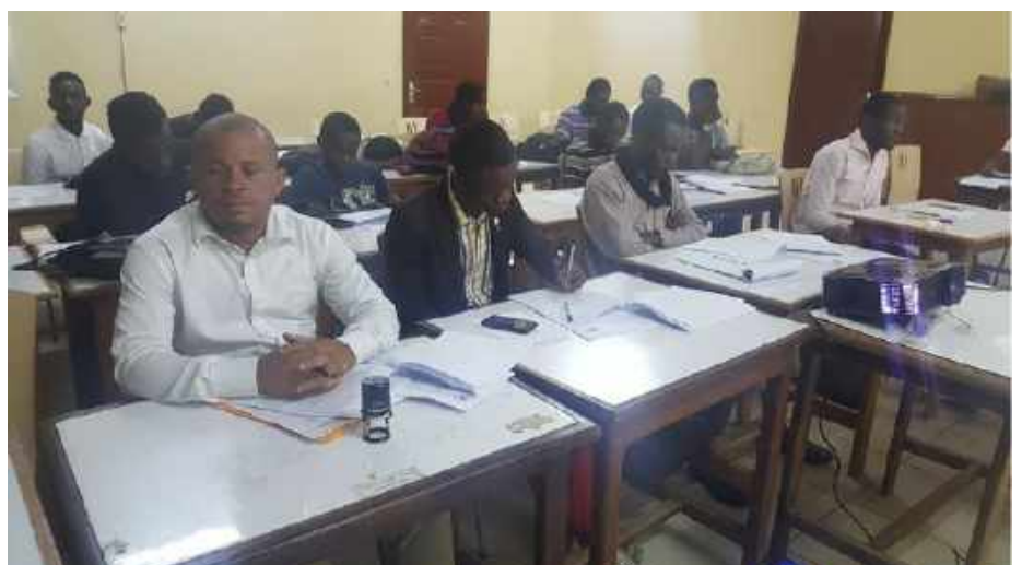
Séance de travail dans une école de la capitale