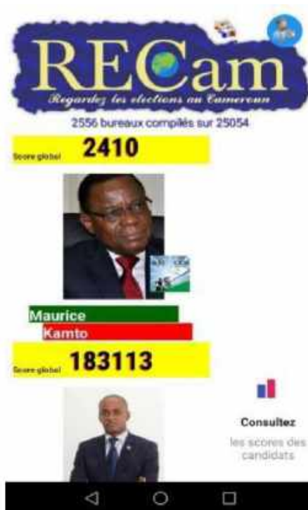
Capture d'écran de l'application RECAM de surveillance du processus électoral au Cameroun

De réels efforts d'innovation lors du suivi des élections ont été entrepris par TLP-Cameroun, notamment avec le développement de l'application mobile RECAM pour surveiller les élections. Il reste aujourd'hui à continuer la mobilisation sociale, pour peser sur la situation post-électorale.