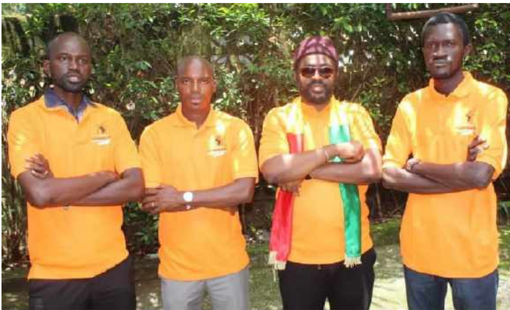
Membres de la nouvelle coalition TLP-Guinée

Dès le début de son action, le mouvement TLP-Guinée a été criminalisé et visé par la répression. Ainsi, un mois après le lancement de la coalition, plusieurs membres de la coalition étaient arrêtés pendant plusieurs semaines entre octobre et novembre 2019.